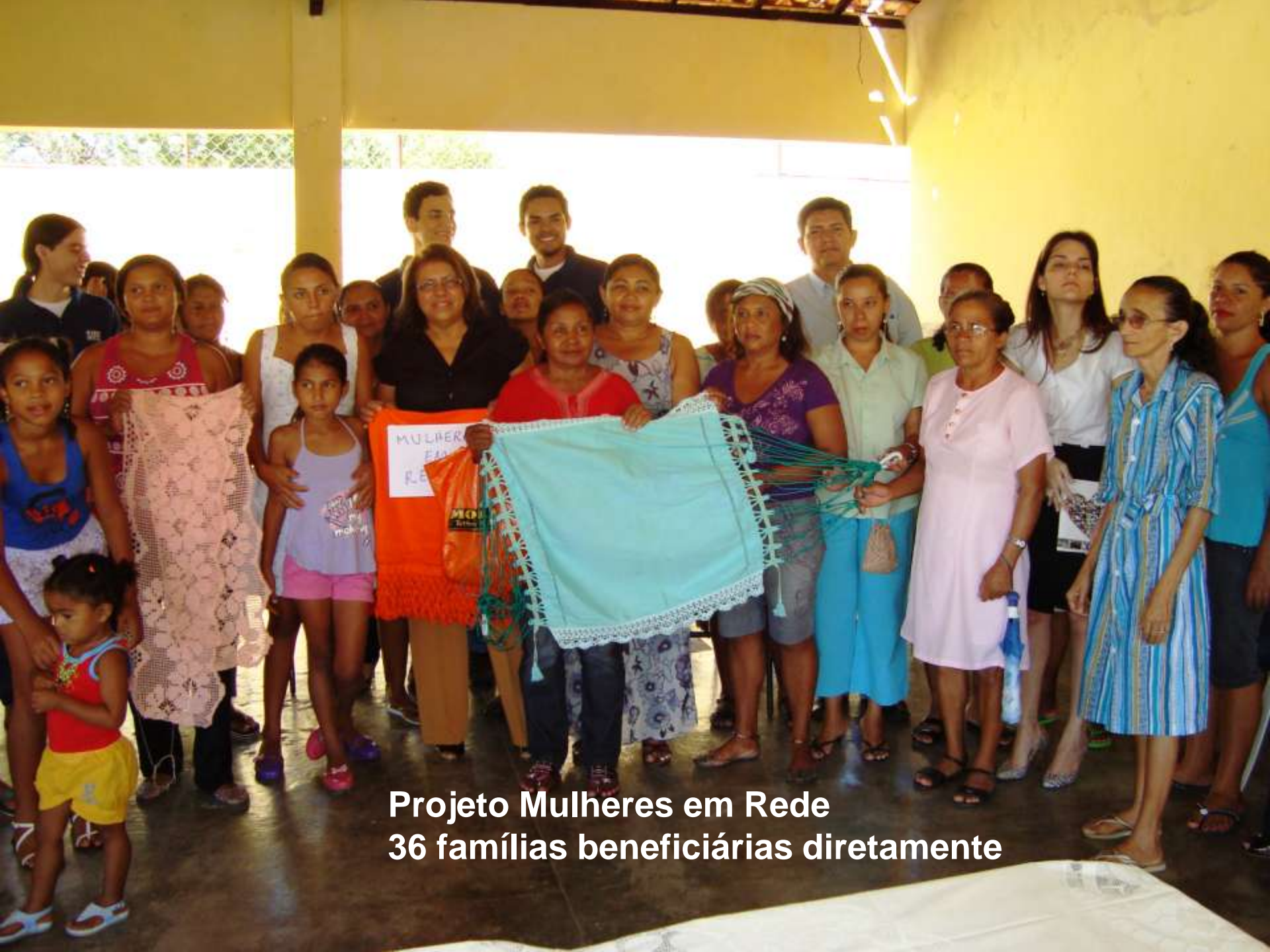
Projeto Mulheres em Rede 36 famílias beneficiárias diretamente